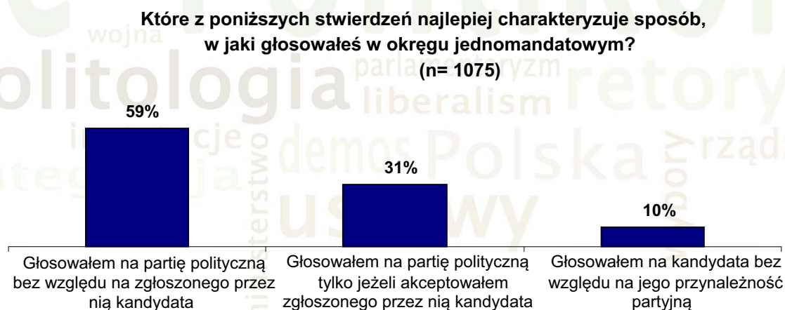
Wykres 2. Czynniki wpływające na decyzje wyborców w okręgach jednomandatowych w wyborach do szkockiego parlamentu (2007 r.)